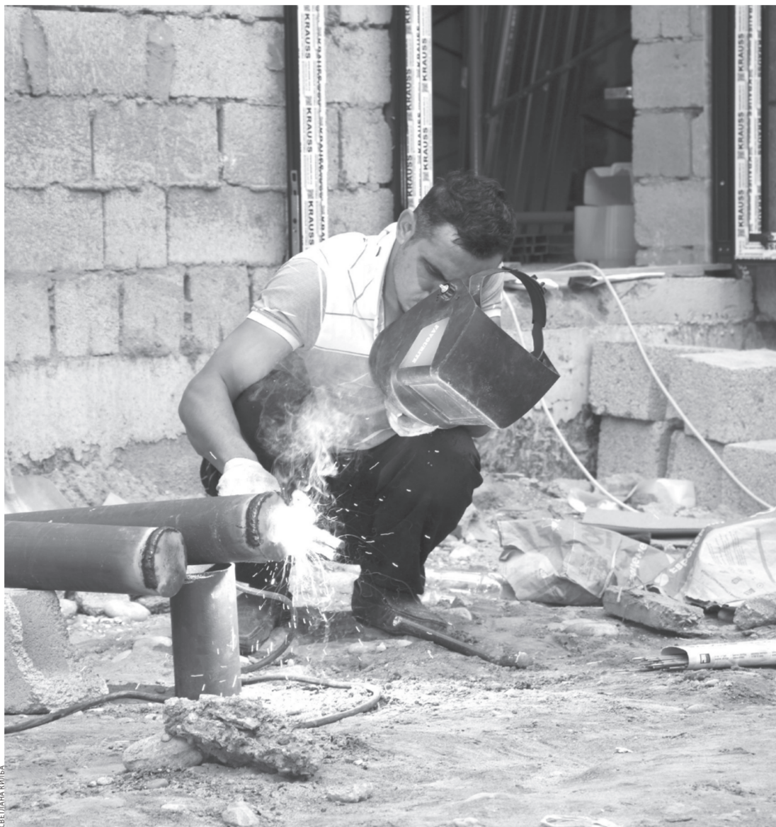
Сварочные работы на объекте близки к завершению

И вот в рамках реализующейся на территории всей России госпрограммы «Развитие образования» в прошлом году началась масштабная стройка. Сегодня уже можно увидеть и определить по красивому дизайнерскому решению оформ-