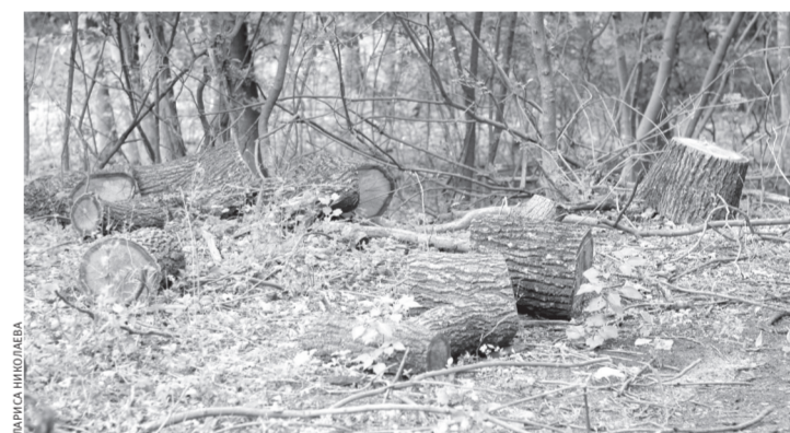
Такой стала лесополоса возле села Пригородного

Теперь уже после грибников заблудили тревогу общественники. Так, например, активисты Народного фронта КЧР неоднократно выезжали в рощу, затем отправили запросы в Минприроды КЧР, надзорные органы и в мэрию города Черкесска. Уже