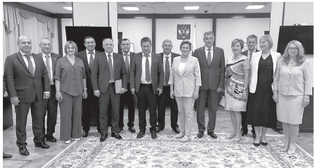
Участники совещания выработали ряд мер социальной поддержки медработников