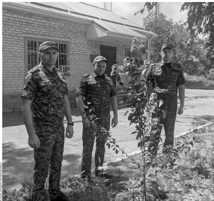
Росгвардейцы посадили деревца в память о павших