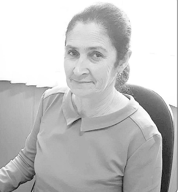
згІвадара багьа лымата, лынхарала адахІвракьа лщардата, лунагІва насыпла гьырчьарала йырчвыта йакІварныс лзыхІтахьпІ.

Хвду эквхІцауа Йынджыгьчкыын кыт гІаныршара администрация сквшцарда руацІа рьачІвагІагІв хьадата йынхауа УША Раиса Умар йпхІа мартІ а 27 йылхьыцІуа асквш 60-ла пхата хІлайхьахивтІ.