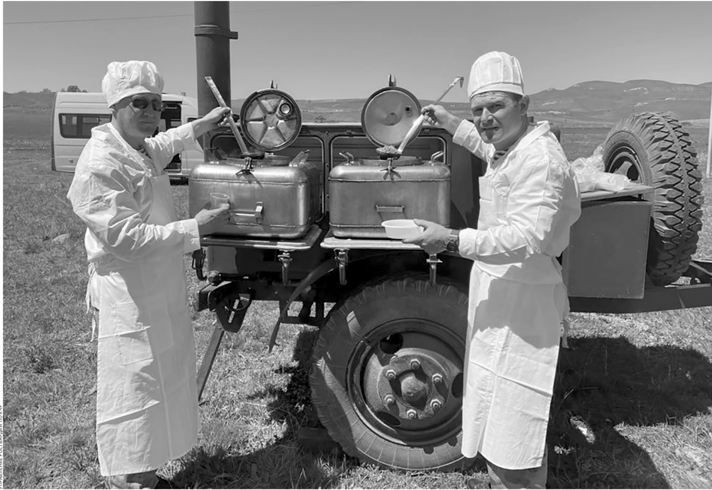
Росгвардейцы накормили участников мероприятия настоящей солдатской кашей

— Дорогие ребята, вы можете выбрать любую из шести номинаций конкурса, которая вас заинтересует. Можете провести исследовательскую работу о героине-интернационалисте, чье имя носит ваш школьный музей или улица, или создать небольшую видеоролик, посвященный герою, написать стихотворение или сочинение. Можете пообщаться с кем-нибудь из наших воинов-афганцев и записать небольшое видеинтервью. Также мы проведем в рамках конкурса летние чтения, на которых вы будете выполнять разные интересные твор-