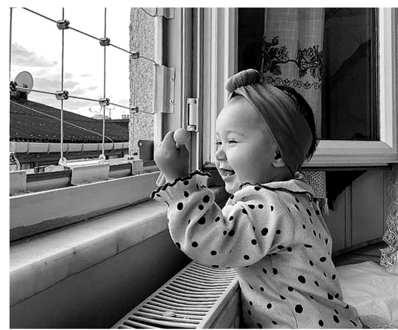
Оконные системы безопасности защитят от беды

Москитная сетка не спасет ребенка от падения. Сколько было случаев, когда дети опирались на неё и выпадали из окон у родителей. Она создает иллюзию надежности и может защитить только от мелких насекомых. А система безопасности от выпадения из окон WinBlock реально может спасти от падения взрослых, детей и даже домашних животных. Сетка крепится на внутренних стойках к оконной раме и выдерживает до 520 килограммов. Испытания на