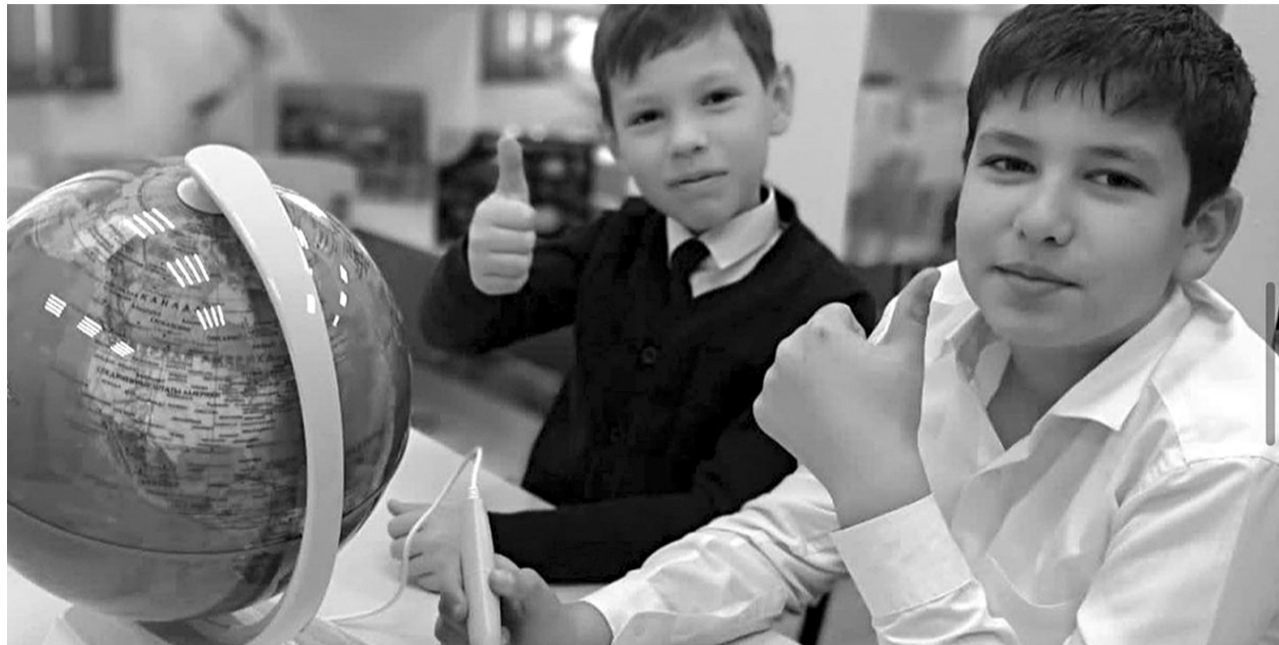
Школьники из Псыра рады открытию в ауле первой в КЧР модульной библиотеки

Средства направлены на ремонт помещения библиотеки, пополнение библиотечного фонда, приобретение интерактивного оборудования и мебели, повышение квалификации работников библиотеки, — добавил Руслан Кужев. Здравоохранение в Абазинском районе представлено РГБУЗ «Абазинская центральная районная поликлиника»: головным подразделением, расположенным в а. Псыж, и четырьмя структурными подразделениями, расположенными в сельских поселениях. В трех подразделениях РГБУЗ «Абазинская центральная районная поликлиника» функционируют 19 коек дневного стационара: 7 коек в поликлинике в а. Псыж и по 4 койки в амбулаториях аулов Кубина, Эльбурган и Инжич-Чукув. Большое внимание уделяется профилактике инфекционных заболеваний. В рамках Национального календаря профилактических прививок охват детского населения вакцинацией составил 100%. По программе «Земский доктор» в 2021 году на работу было принято три врача (педиатр и два врача УЗИ), что позволило улучшить качество медицинской помощи, оказываемой жителям района. Говоря о сельском хозяйстве, Р. Кужев отметил, что это ведущая отрасль, которая вносит основной вклад в формирова-