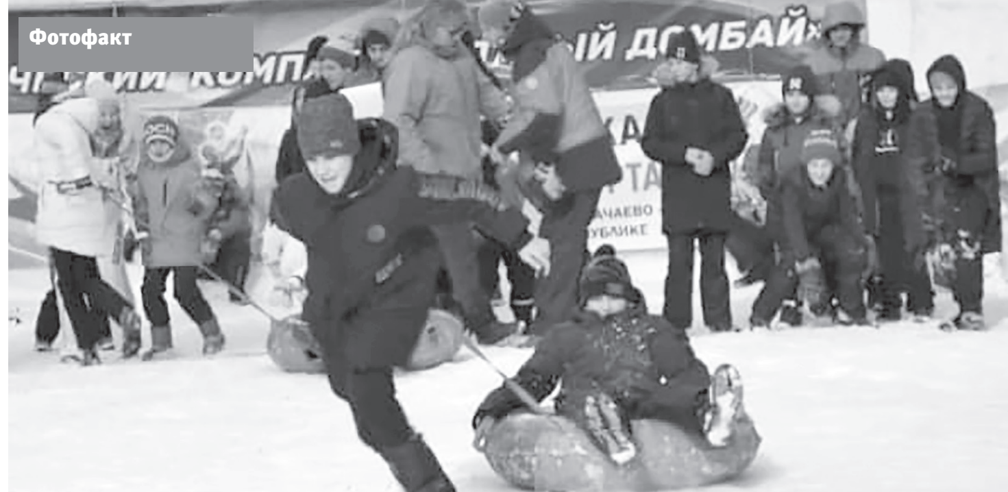
В республике прошла традиционная декада спорта и здоровья. В ходе нее было проведено 17 спортивно-массовых мероприятий с участием более 7 тысяч человек

Принимая участие в траурных мероприятиях, выражая скорбь и поддержку, мы обращаемся к вам с просьбой выразить свои соболезнования и поддержку семье.