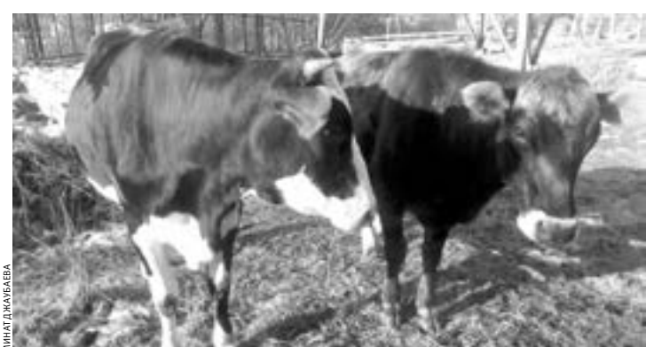
Вот таких буренок выращивает Ильяс Эльканов

— Реальные плоды труда в наше непростое время — ценнейшее