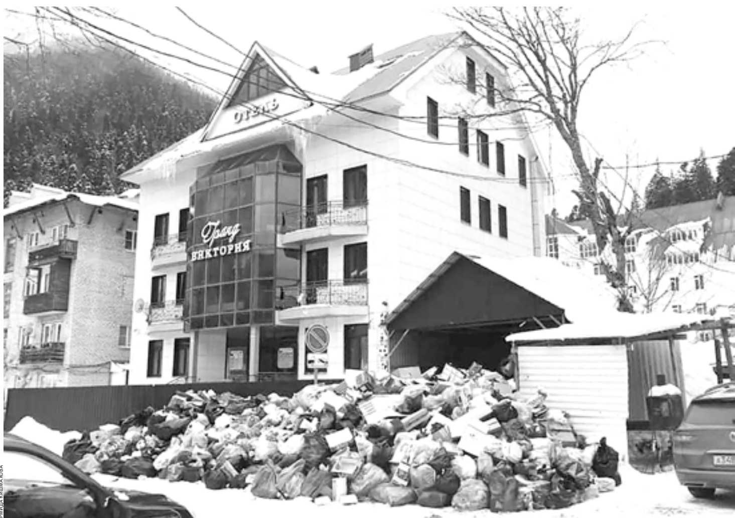
И таких «пейзажей» в Домбае, увы, немало

Сюда съезжались туристы со всего Советского Союза, здесь проводились международные фестивали и всевозможные молодежные форумы. Многие мои знакомые сегодня с сожалением констатируют, что это место