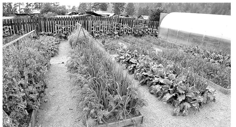
Июнь — отличный месяц для роста растений