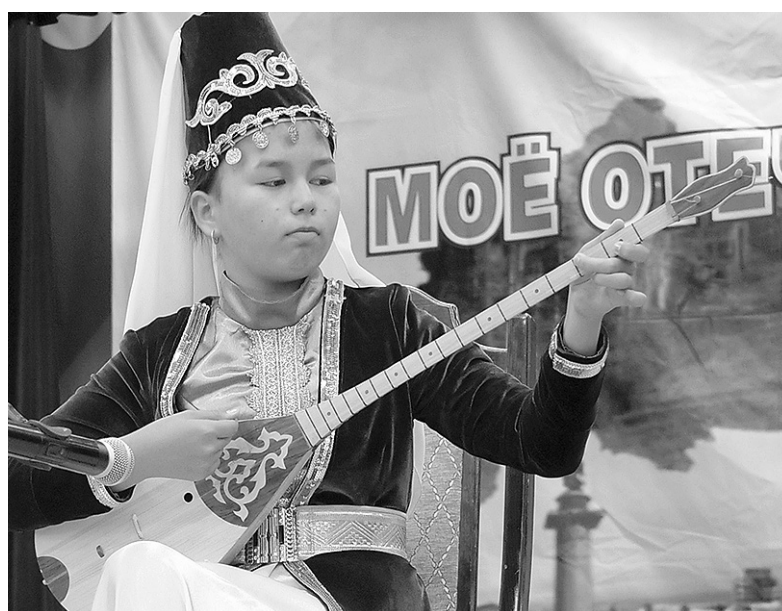
Домбыра — душа ногойского народа

В своем обширном докладе «История становления и современности