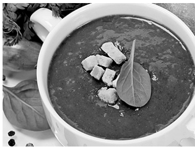
Суп со шпинатом очень полезен

Ингредиенты: сливочное масло — 50 г, репчатый лук — 1 шт., чеснок — 2 зубчика, картофель — 2–3 шт., куриный или овощной бульон — 500 мл, молоко 3,2% жирности — 500 мл, шпинат (свежий или замороженный) — 450 г, половинка лимона, соль, молотый перец, мускатный орех — по вкусу. По желанию — жирные сливки, по 1 ст. ложке на каждую порцию.