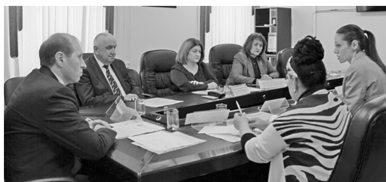
На заседании Общественного совета состоялся деловой разговор

— Каждому юрлицу или ИП с 2023 года будет открыт единый счет в Федеральном казначействе, куда можно будет перечислять ЕНП с указанием только суммы платежа и ИНН налогоплательщика. ФНС самостоятельно будет засчитывать ЕНП в счет уплаты