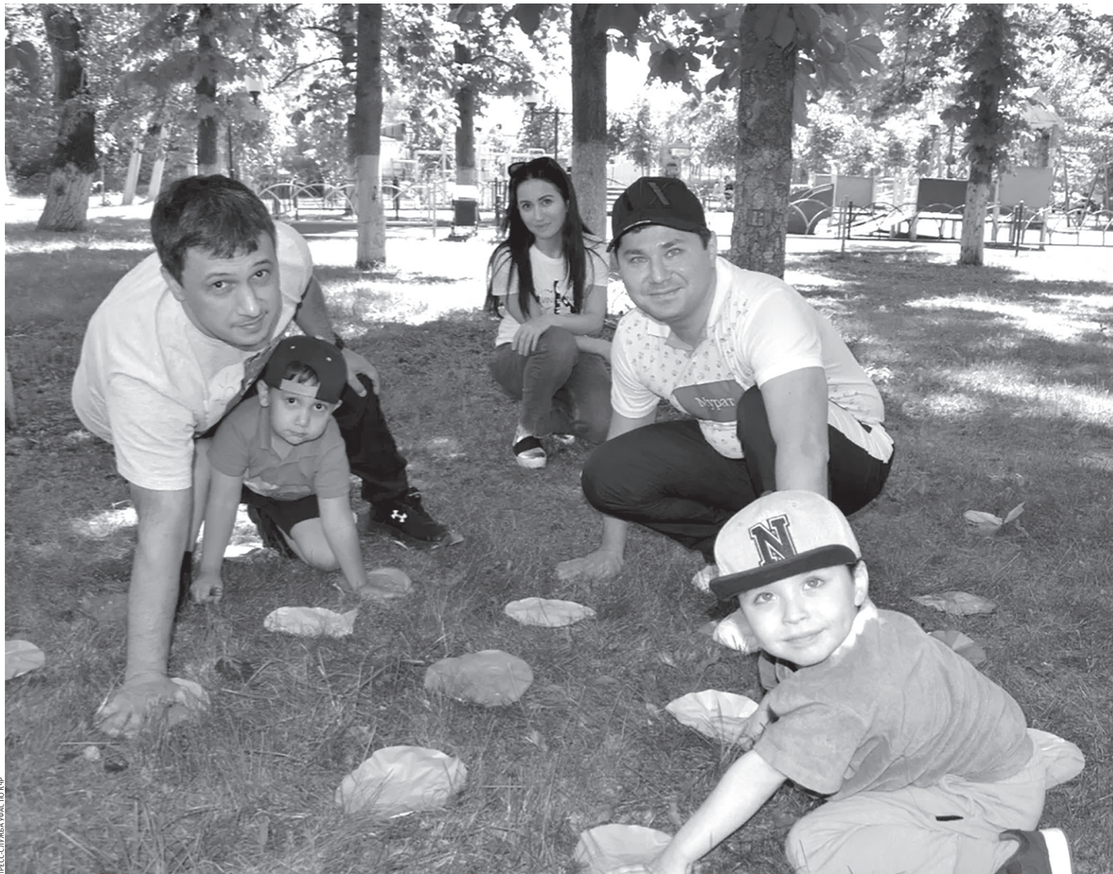
И детям, и взрослым тренинг «Антимонопольная семья» был интересен

На территории парка «Зеленый остров» в Черкеске прошел игровой тренинг «Антимонопольная семья»