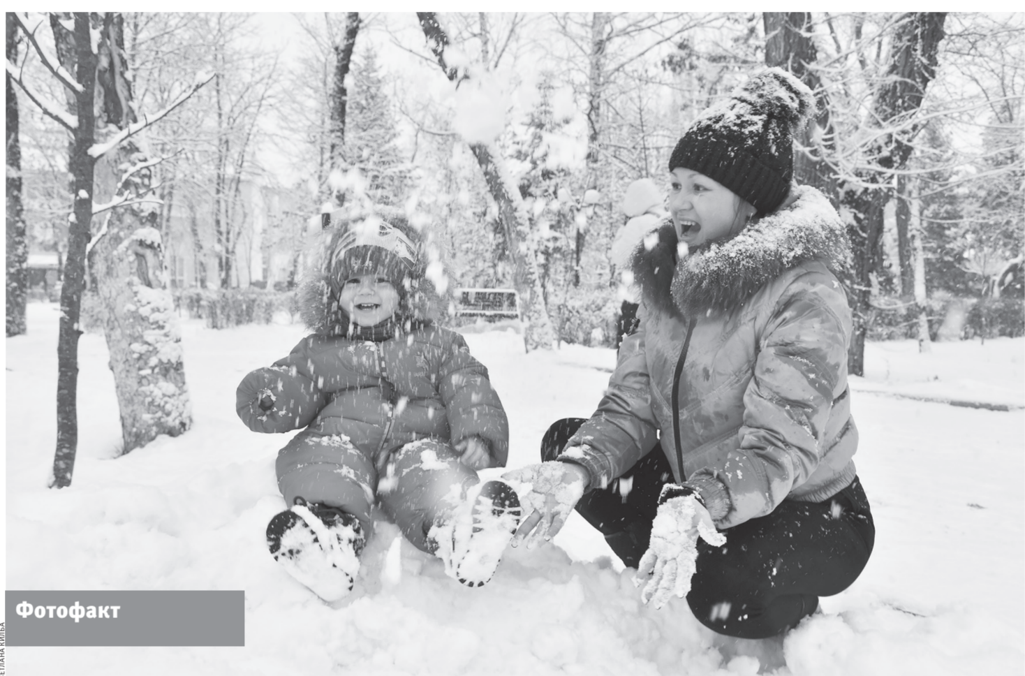
На Татьянин день с утра Черкесск завалило снегом. Вы успели поиграть со своими детьми в снежки?