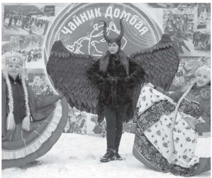
В организации «Дня чайника» очень помог ГК «Старый Домбай»

С 17 по 22 января в пос. Солнечное проходило первенство Ставропольского края по боксу среди юношей 15–16 лет на Кубок главы Изобильненского городского округа. В рамках турнира