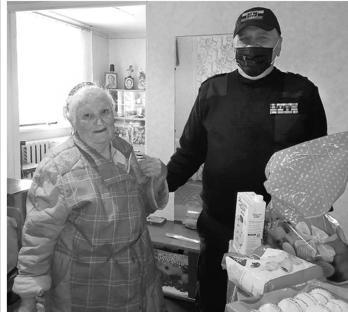
Джорукъ сакълагъан къуллукъланы Къарачай