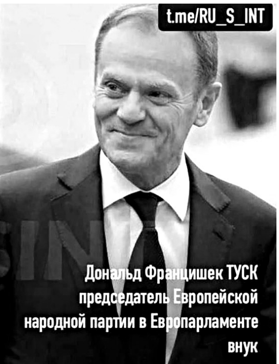
Дональд Францишек ТУСК председатель Европейской народной партии в Европарламенте внук