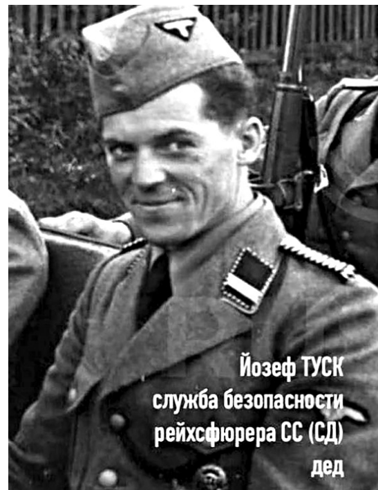
Йозеф ТУСК служба безопасности рейхсфюрера СС (СД) дед

«Мёртвая голова», дивизии СС «30 января», дивизии СС «Богемия и Моравия». Осенью 1944 года в составе Вермахта из граждан Польши сформировался дивизионный «Легион Белого орла», численностью 700 чело-