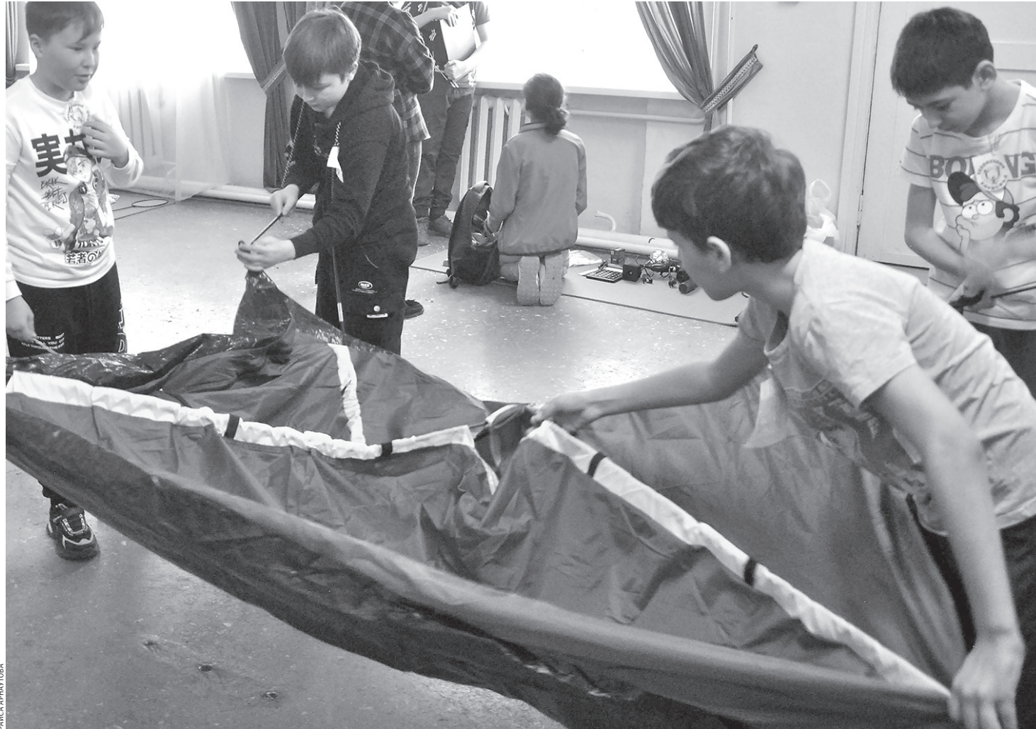
Трудно управиться с незнакомой палаткой

День здоровья — вселенский праздник спорта, здоровья и хорошего настроения. С особым нетерпением его ждут школьники. На один день лицей № 15 Черкесска превратился в спортивную арену, каждый уголок которой был посвящен разным видам спорта.