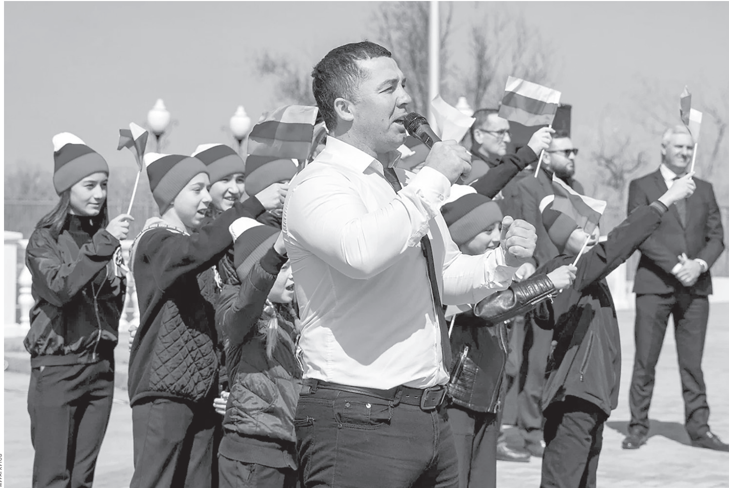
Митинг-концерт в честь годовщины государственной самостоятельности ДНР

В концерте-митинге, который проходил у стелы «Дружба народов Карачаево-Черкесии», приняли участие около 400 жителей республиканского центра. Это были представители политических партий, профсоюзных и общественных организаций, деятели культуры, ветераны Вооружённых Сил и МВД, политики, общественники, известные спортсмены и просто горожане. Многие из них выступили перед собравшимися, выразив свою солидарность с политикой Президента России и высказав слова поддержки российским военнослужащим, выполняющим поставленные задачи на Украине.