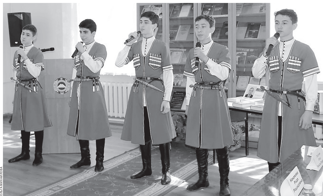
Участников мероприятия приветствовал ансамбль «Къарча»

В актовом зале Государственной Национальной библиотеки КЧР им. Х. Байрамуковой прошел День абазинской литературы и искусства. Мероприятие прошло в рамках празднования 100-летия автономии Карачаево-Черкесии, подготовки к празднованию 100-летия ГНБ им. Х. Б. Байрамуковой и к Году культурного наследия народов России, объявленному Указом Президента РФ.