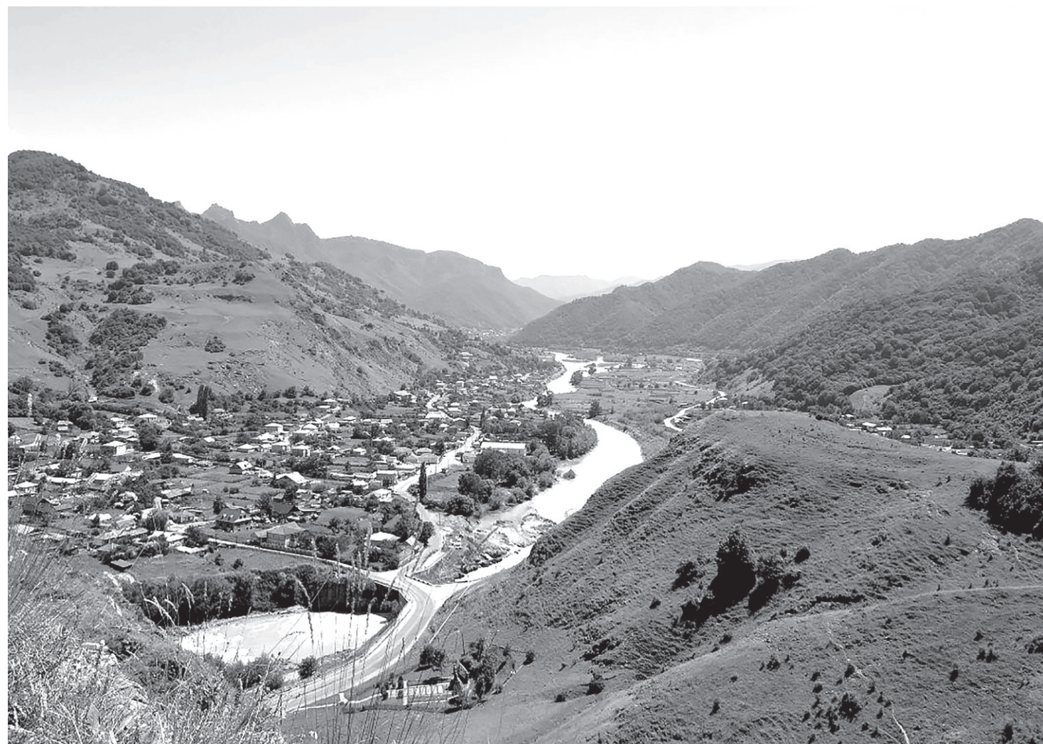
Аул Каменномост в XXI веке

В статистической отчетности Российской империи аул Каменномост числится с 1870 года