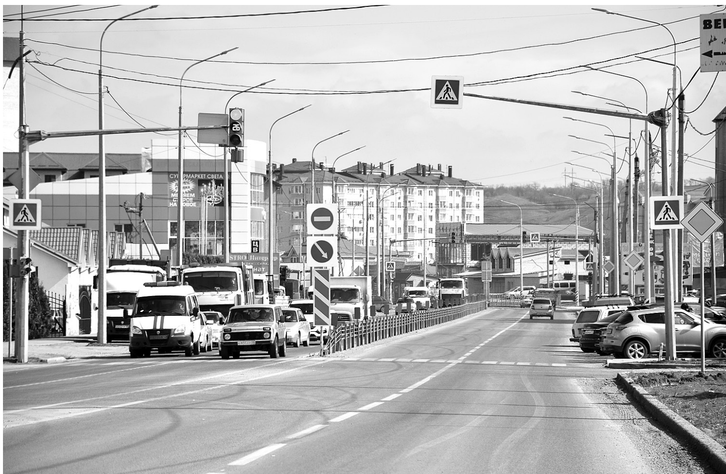
Современные автомобильные магистрали в Черкесске