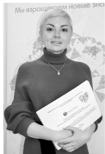
Моя взрастает новые зно

Все красно-оранжевые фрукты и овощи содержат пигменты – каротиноиды и ликопин, из которых в здоровом организме образуется бета-каротин. Так можно запастись провитамином А на 3 – 5 месяцев. Аскорбинка или витамин С присутствует во всех свежих овощах и фруктах. В печени он способен накапливаться до 1,5 г, которых хватит на пару месяцев. Запасы фолиевой кислоты, фолата (витамина В9) в организме человека могут доходить до 2 мг и также поддерживать нас около двух месяцев (фолатами богата зелень).