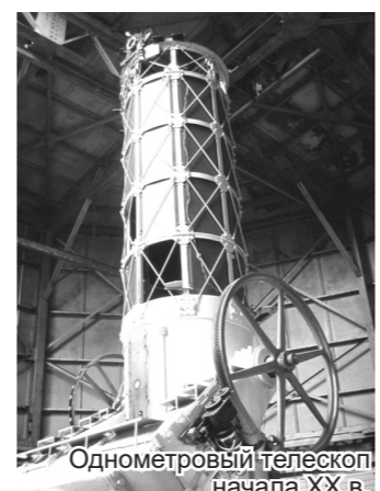
Однометровый телескоп, начала XX в.

Хозяева подробно познакомили меня с университетом, но я, надо сказать, прибыл сюда с некоторым знанием - мне предстояло знакомство со Смитсоновским центром астрофизики, признанным и наиболее авторитетным в мире астрофизическим учреждением. Стоит сказать несколько слов и о его истории. На самом деле Смитсоновский астрофизическая обсерватория (CAO - «тэзка» нашей обсерватории!) была основана в каждом Смитсоновском замке в Вашингтоне 1 марта 1909 г. Первоначальная её цель состояла в том, чтобы «зафиксировать количество и характер тепла Солнца». Но в 1955 году научная штаб-квартира Смитсоновская переехала из